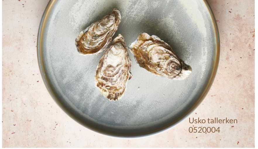
Usko tallerken 0520004