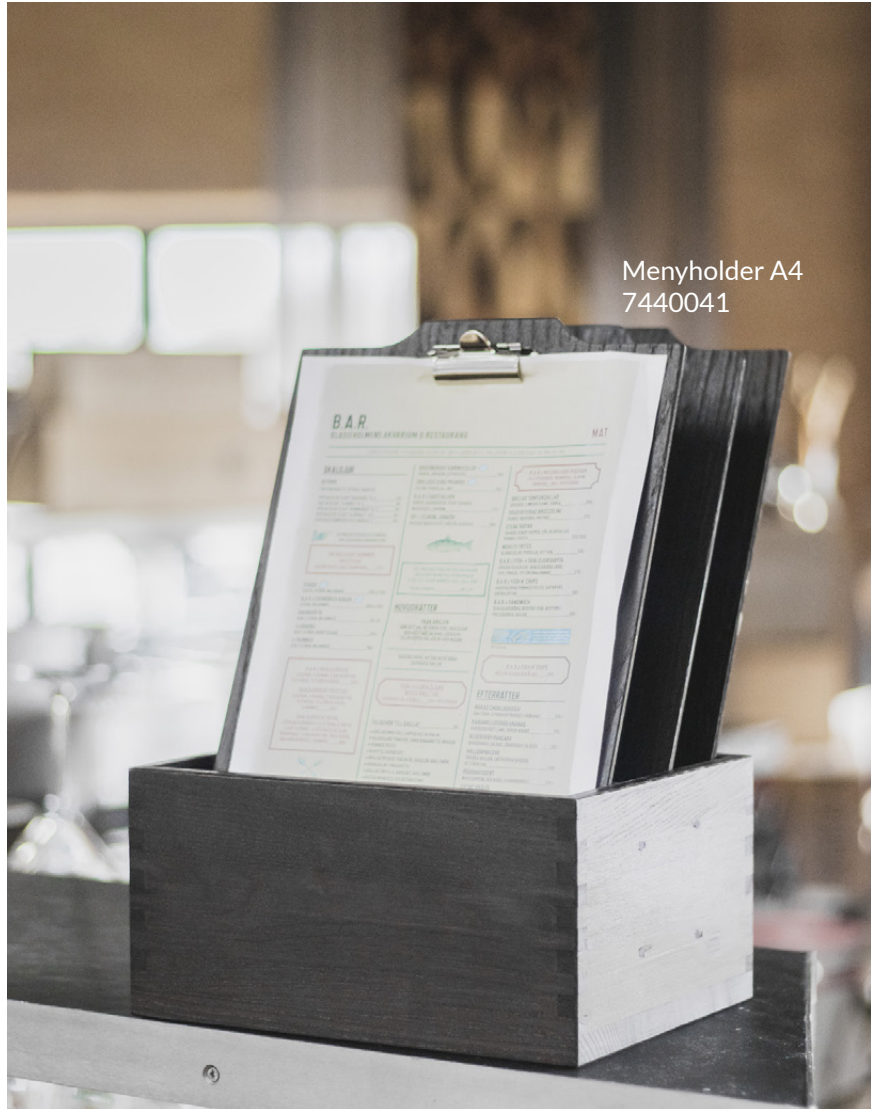
Menyholder A4 7440041