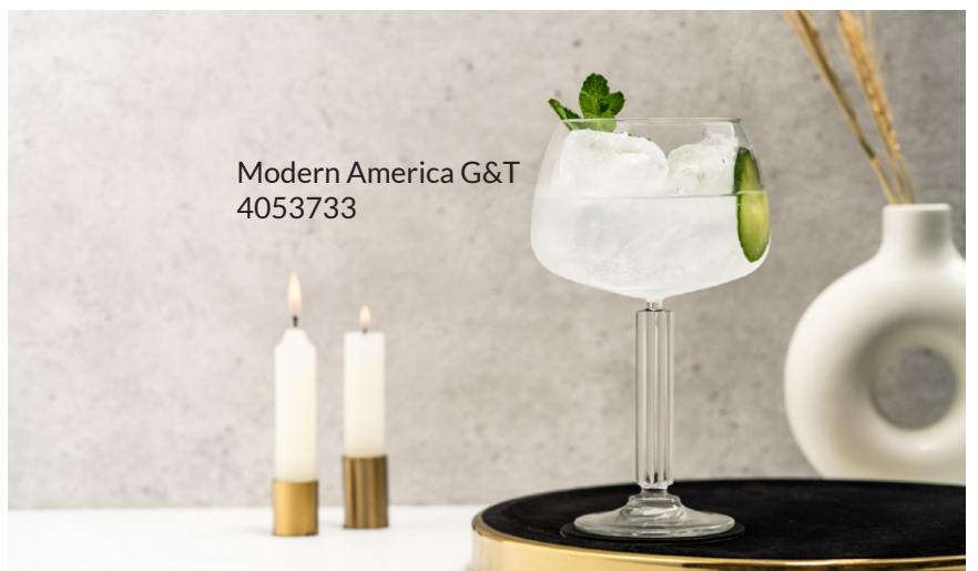
Modern America G&T 4053733