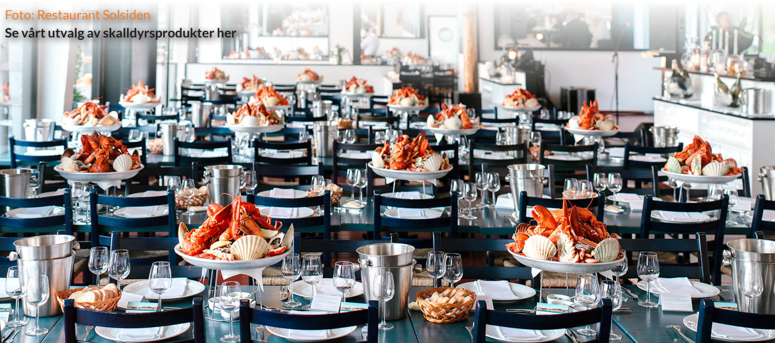
Se vårt utvalg av skaldyrsprodukter her