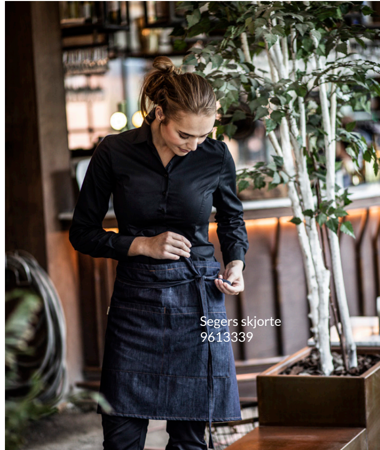
Segers skjorte 9613339