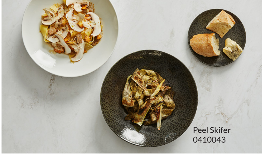
Peel Skifer 0410043