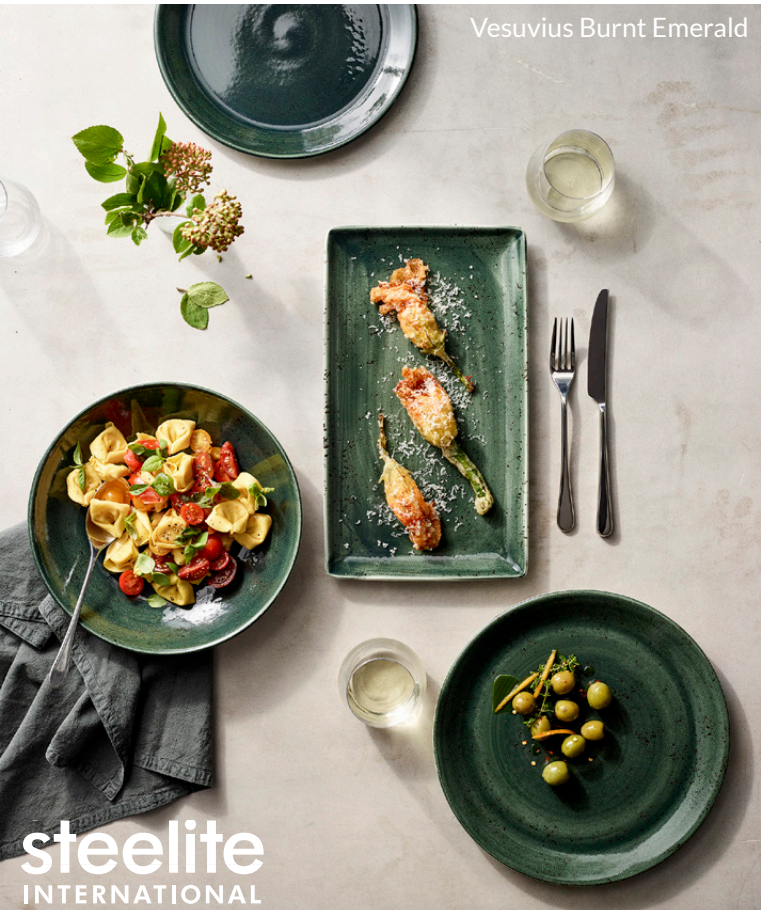
Vesuvius Burnt Emerald