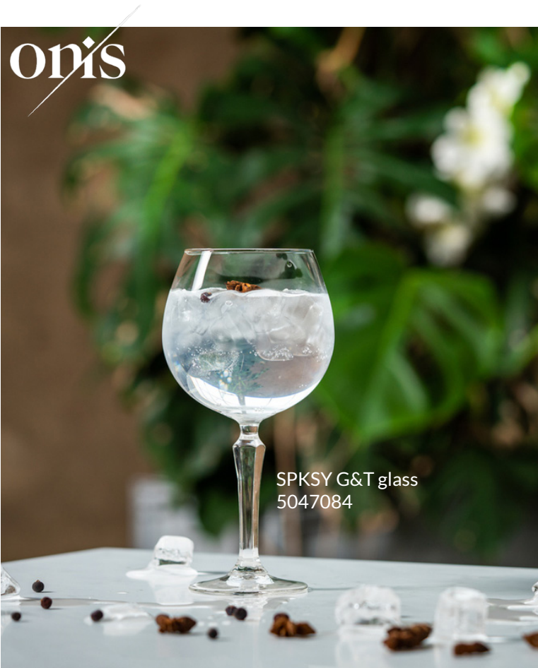
SPKSY G&T glass 5047084