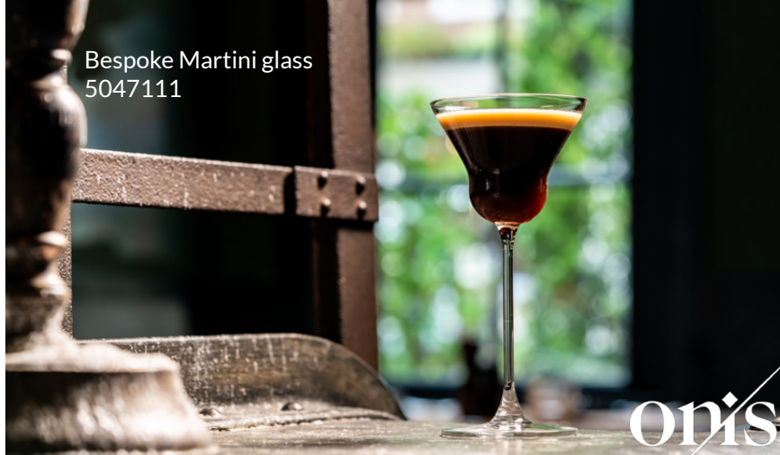
Bespoke Martini glass 5047111