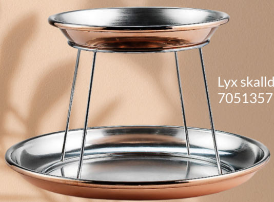
Lyx skaldyrsfat 7051357