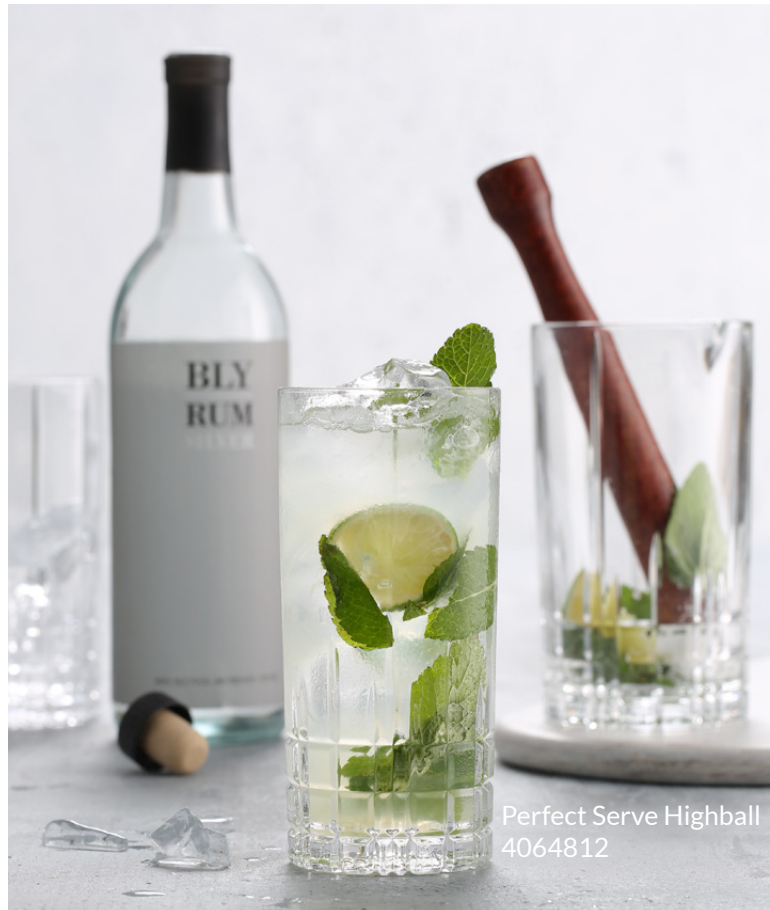
Perfect Serve Highball 4064812