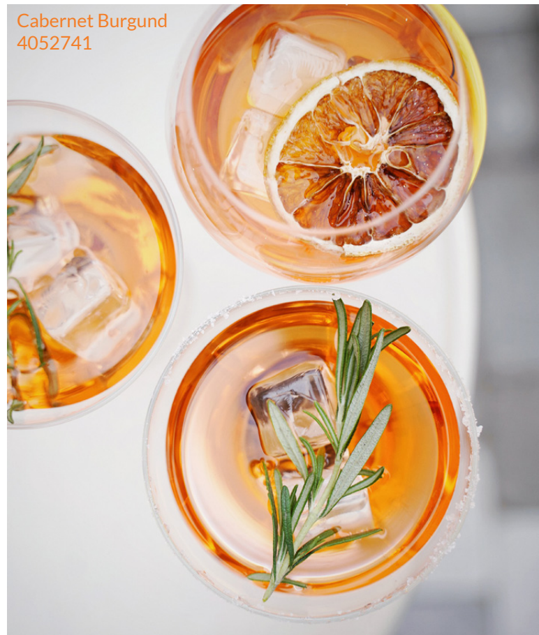
Cabernet Burgund 4052741

Se vårt utvalg av skaldyrsprodukter her