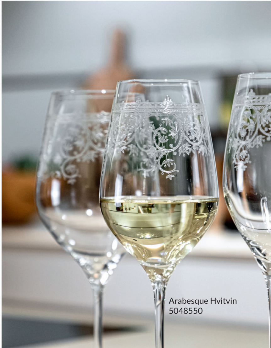
Arabesque Hvitvin 5048550