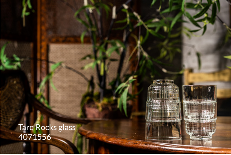
Tarq Rocks glass 4071556