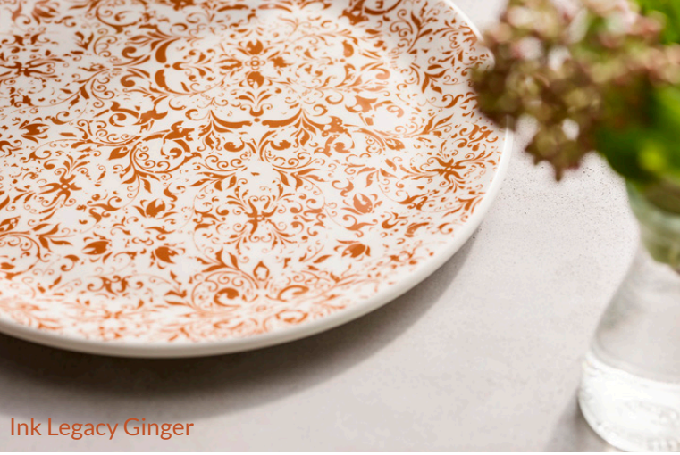
Ink Legacy Ginger