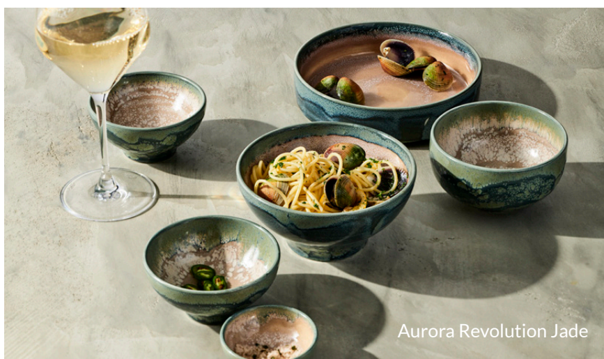
Aurora Revolution Jade