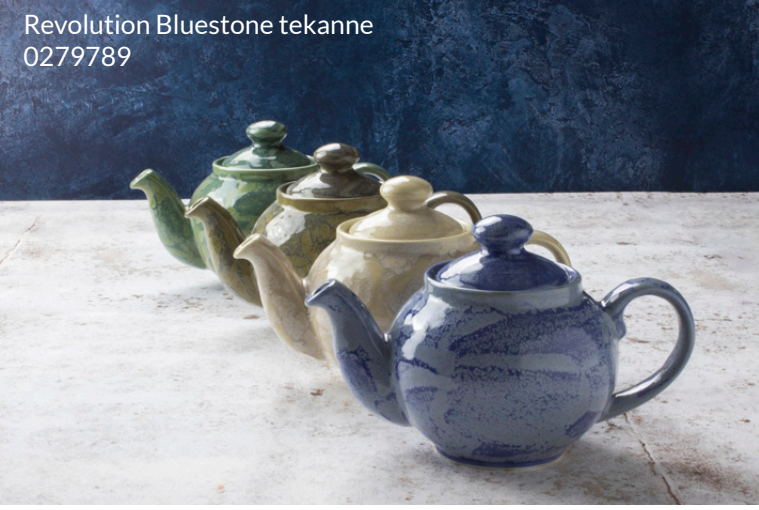
Revolution Bluestone tekanne 0279789